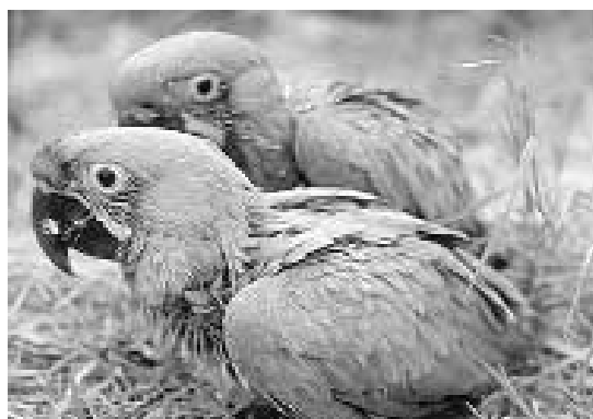
Auch diese Papageien sind Nestdieben zum Opfer gefallen. Nur durch Überwachung der Brutplätze kann der Ausverkauf dieser beliebten Vögel verhindert werden.

zu betreiben. Die Kurse sollen zukünftig nicht nur in Matamoros abgehalten werden, sondern auch im südlichen Teil des Nationalparks, um Rodungen dort aufzuhalten. "Das uns vorliegende Satellitenbild bestätigt eindrucksvoll die Notwendigkeit dieser Maßnahme", schreibt Projektleiter Hauke Hoops in seinem Bericht aus Honduras.