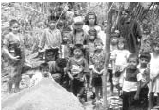
Wie kann ich später mit Landwirtschaft überleben ohne dem Regenwald zu schaden? Das lernen die Kinder von Matamoros im praktischen Unterricht neben Lesen und Schreiben.

Freunde und Förderer für Natur und Kultur im Regenwald