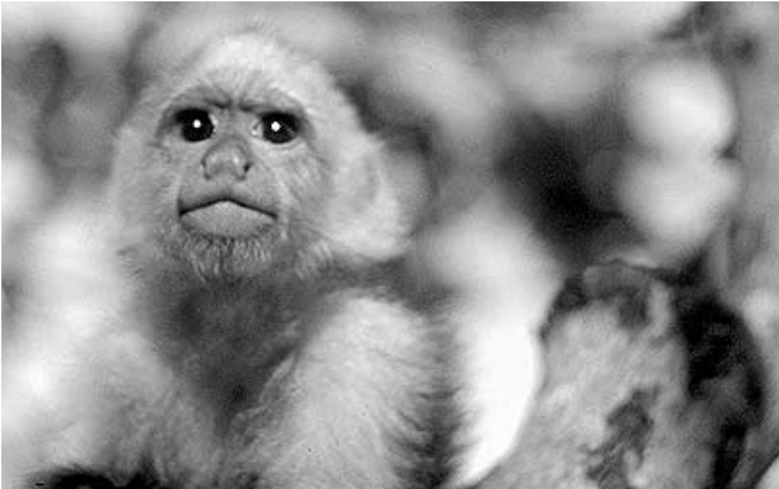
Im Regenwald zuhause: Die Weisskopffaffen (Bild) leben neben zwei anderen Affenarten im Nationalpark Patuca.

Freunde und Förderer für Natur und Kultur im Regenwald